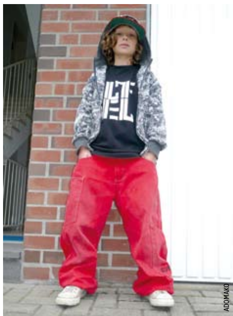
Cool sein ist Ehrensache.

muss sacken, die Schuhe müssen schlackern, die Haare müssen bis zur Bretthärte gegelt, oder lasch wie zu lange gekochte Spaghettis bis über die Schultern hängen und das halbe Gesicht bedecken. Hauptsache cool. „Cool“, das bestätigt auch