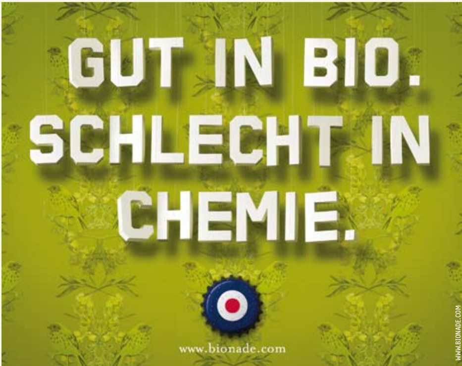
Im Jahr 2008 warb das Unternehmen mit gewitzten Botschaften.