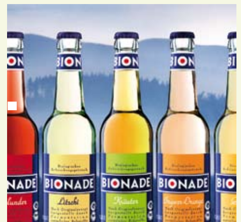
Brause am Puls der Zeit.