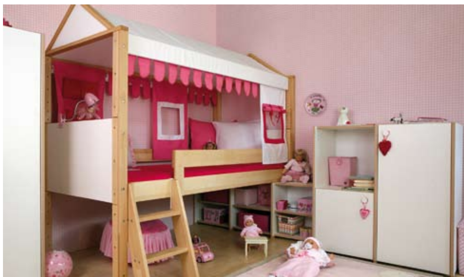
Wie im Puppenhaus. Mädchen mögen es meistens verspielt.

Wer partout ein quietschbuntes Kinderzimmer aus einem Guss haben will, tut gut daran, sich an Hersteller zu halten, die garantiert schadstofffreie Farben und Lacke für ihre Möbel verwenden oder die unbehandelte Holzmöbel anbieten – wie die bereits erwähnten Manufakturen De Breuyn Möbel GmbH in Köln, die Firma Woodland Kindermöbel in Dormagen oder die Firma Stokke, die seit fast 40 Jahren den bekannten und preisgekrönten Tripp-Trapp-Stuhl herstellt und wie bei Woodland viele Standards und Normen übertrifft. Solche Hersteller versichern nicht nur die Schadstofffreiheit ihrer Produkte, sondern bieten zudem mitwachsende Möbel an, die bis zu 15 Jahre durchhalten. Das ist praktisch und auch umweltfreundlich, wenn nicht alle paar Jahre eine neue Einrichtung gekauft werden muss. Ein Gitterbett, das sich zum Hochbett umbauen lässt, eine Wickelaufgabe, die später zur Kommode wird, der Tripp-Trapp-Stuhl, der zuerst als Hochstuhl und später als Schreibtischstuhl zum Einsatz kommt – das sind ideale Möbel für Kinder.